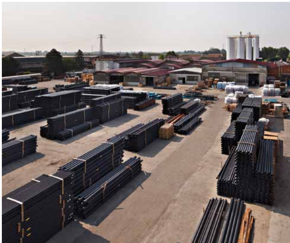
Veduta parziale del magazzino pressione.