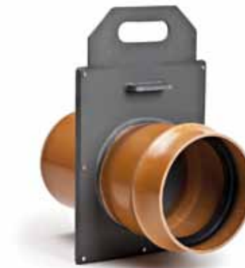
Serranda a ghiottina Pvc