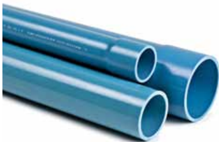
PVC pozzi artesiani