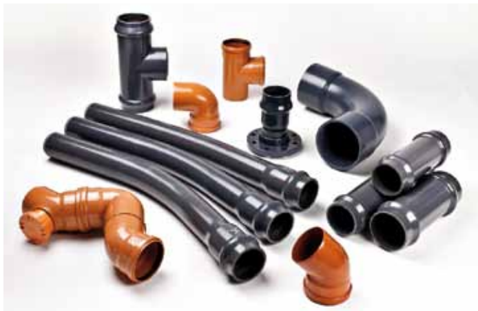
Raccordi PVC Pressione - Fognatura