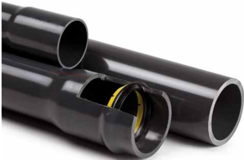
Tubi PVC Pressione per convogliamento acque potabili, applicazioni industriali e irrigazione.