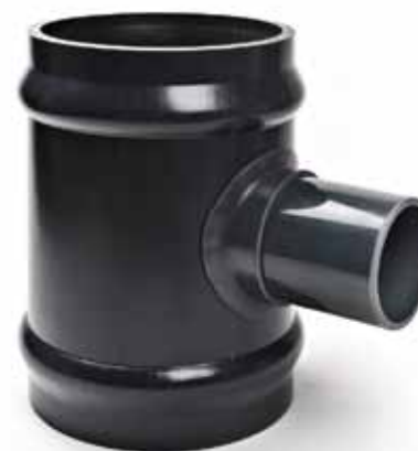
Tee ridotti grandi diametri