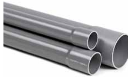
PVC NF sicurezza al fuoco ME