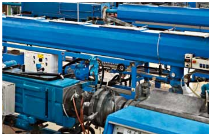
Linee di estrusione