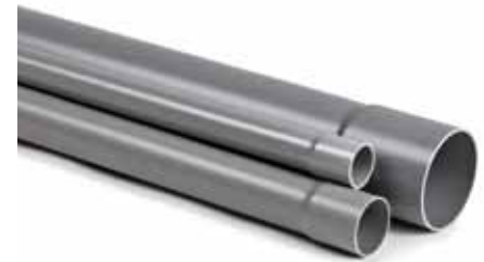
PVC telecomunicazione LST