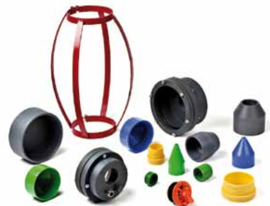
Raccordi pozzi artesiani