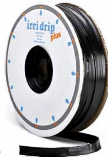
Irridrip® - ala gocciolante leggera