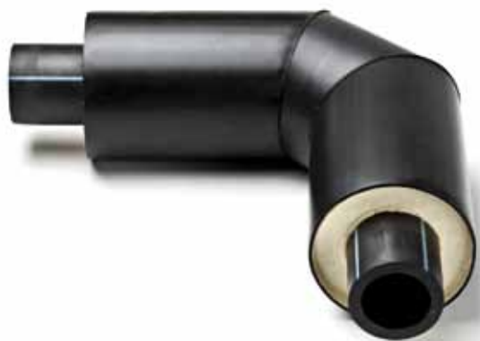
Raccordi preisolato PVC PE