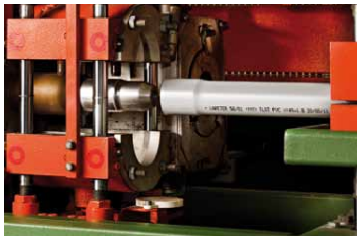
Dettaglio termoformatura giunto